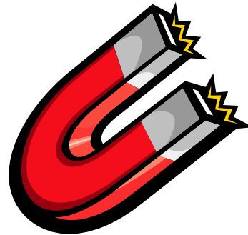
Λεζάντα που περιγράφει την εικόνα ή το

Lorem ipsum dolor sit amet, consectetur adipiscing elit, sed diam nonummy nibh euismod tincidunt ut lacreet dolore consectetur adipiscing elit, sed diam nonummy nibh euismod tincidunt ut lacreet dolore magna aliquam erat amet, consectegna aliquam erat.